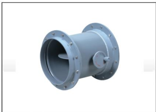
ボリュームダンパー