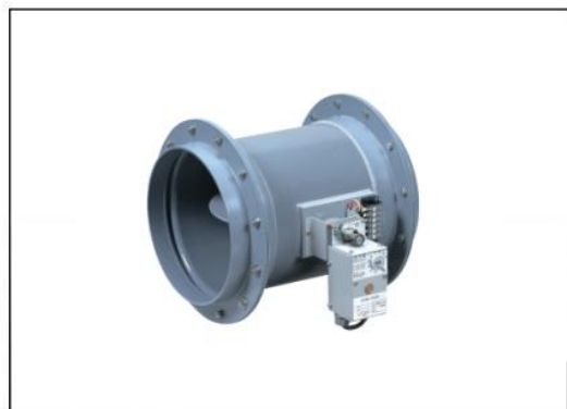
モーターダンパー