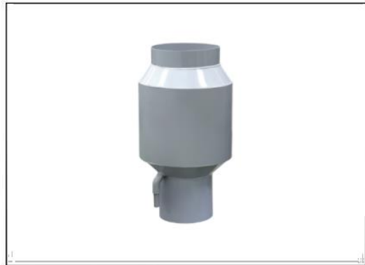
ベンチレーター S2型