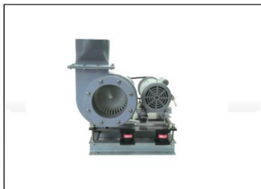
スプリング防振架台(設置例)