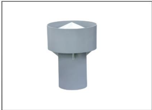
ベンチレーター S1型